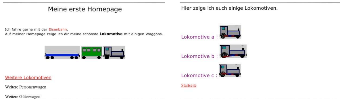
Abbildung 2.4: Vernetzung von index.html und lokomotive.html

In der Browser-Vorschau kannst du nun zwischen diesen beiden Seiten hin und her wechseln.