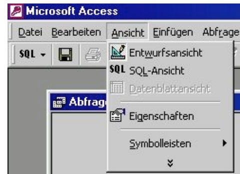
Abbildung 3.4: Auswahl über Menüleiste