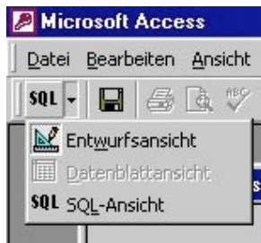
Abbildung 3.2: Auswahl über Symbolleiste