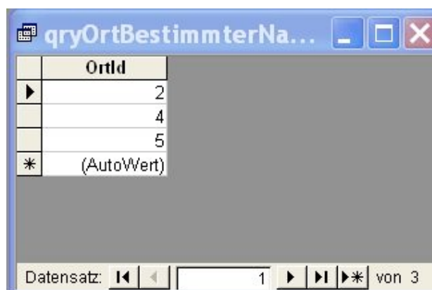
Abbildung 3.15: Tabelle der Ortsnummern der Orte mit Namen Pforzheim und Freiburg

SELECT OrtID FROM Ort O WHERE (O.Ort = ‚Pforzheim‘) OR (O.Ort = ‚Freiburg‘)