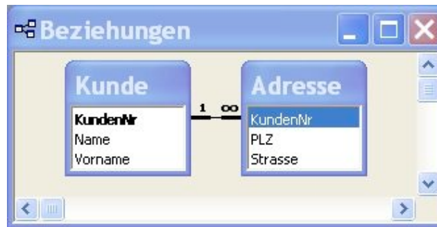
Abbildung 3.7: Die Datenbank Kundschaft