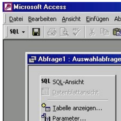
Abbildung 3.3: Auswahl über die rechte Maustaste