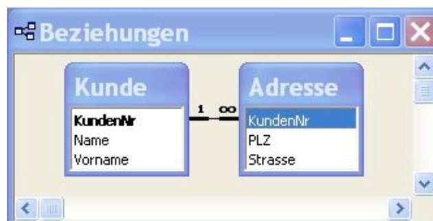
Abbildung 3.13: Die Datenbank Kundschaft

SELECT Name, Strasse FROM Kunde INNER JOIN Adresse ON Kunde.KundenNr = Adresse.KundenNr WHERE Name = ‚Gasser‘