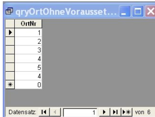
Abbildung 3.14: Tabelle der Ortsnummern mit Kursen ohne Voraussetzung

Beispiel: Gesucht sind die Ortsnummern der Orte, deren Namen Pforzheim oder Freiburg sind.