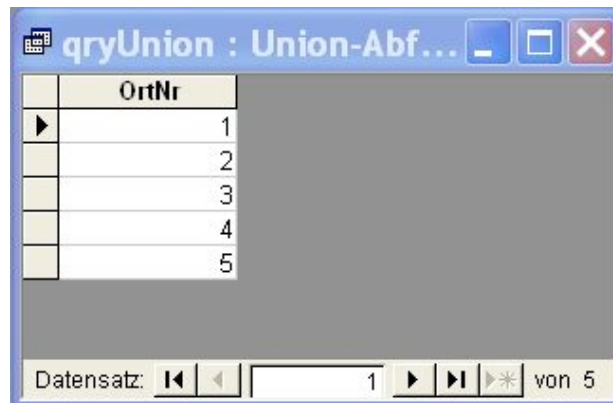
Abbildung 3.16: Tabelle der Ortsnummern mit Kursen ohne Voraussetzung oder mit Namen Pforzheim und Freiburg

WHERE K.Voraussetzungen = ‚keine‘ UNION SELECT OrtID FROM Ort O WHERE (O.Ort = ‚Pforzheim‘) OR (O.Ort = ‚Freiburg‘)